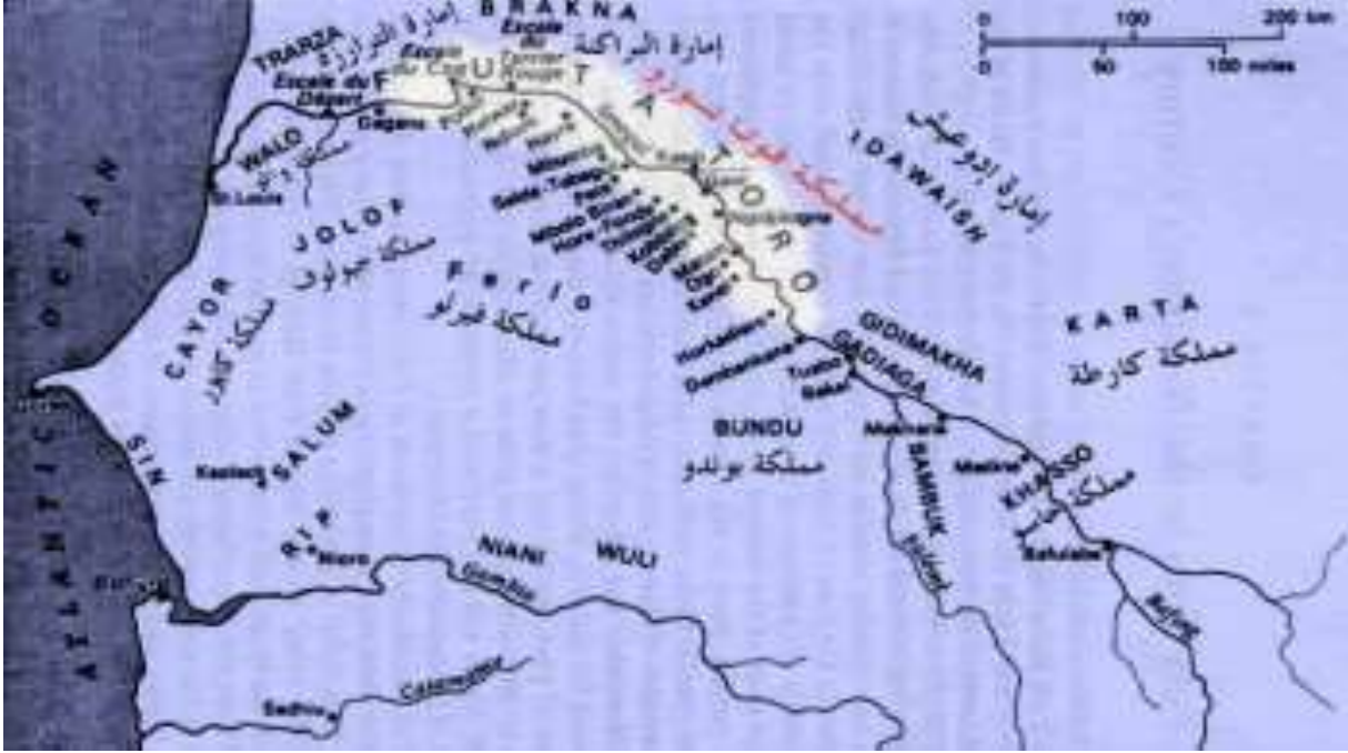
دولة الحاج عمر في أقصى اتساعها

هذه الإجراءات وإن كانت ظرفية، فقد أثبتت فعاليتها، على إثر الخسائر المادية والبشرية التي تكبدها المستعمر، إلا أنها لم تحول دون وقوع مواجهة عسكرية بين الطرفين، التي جعلت الحاج عمر يغير في إستراتيجيته ضد الفرنسيين في المرحلة المقبلة من الصراع.